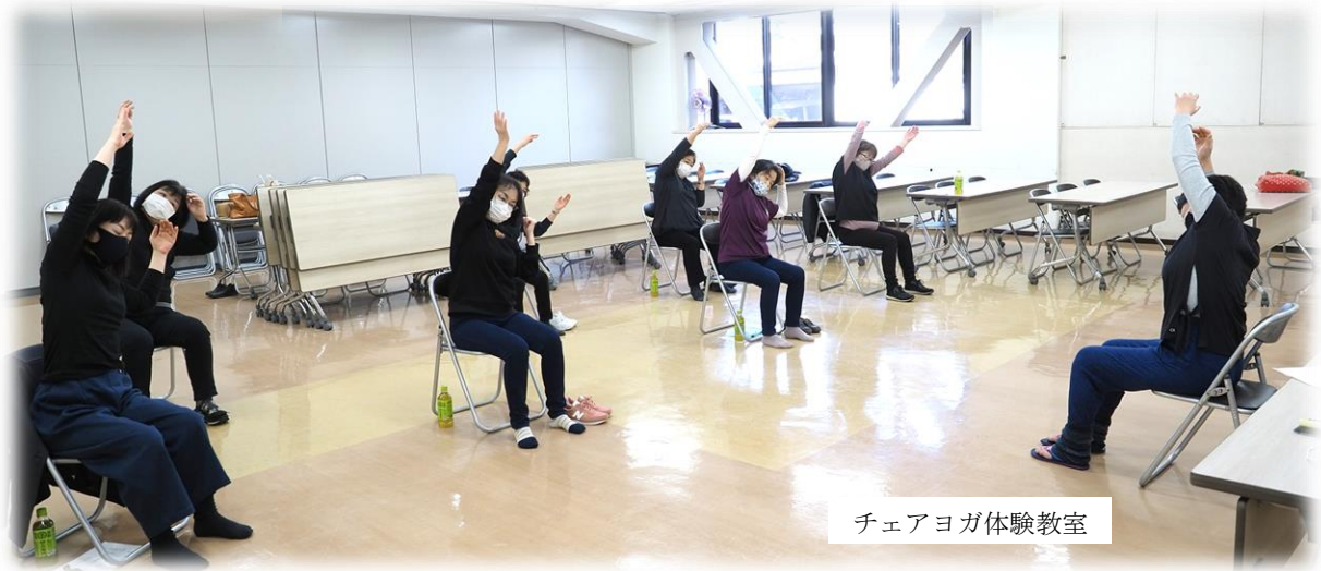
チェアヨガ体験教室