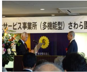
感謝状授与式風景